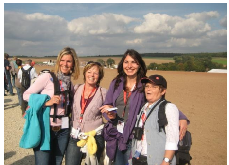
Erzieherinnen unserer Kita auf dem Pilgerweg

(Papst Benedikt im Wort zum Sonntag am 17.9.2011)